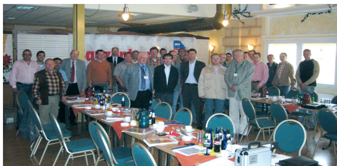
42 Fachhandwerker aus Nord- und Westdeutschland genossen eine informative Veranstaltung