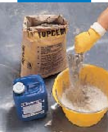
Herstellung einer geeigneten Haftschrämme mittels Topcem und Planicrete