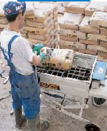
Anmischen des Topcem-Estrichmörtels