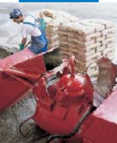
Geeignete Misch- und Fördertechnik für den fachgerechten Einbau des Topcem-Estrichmörtels