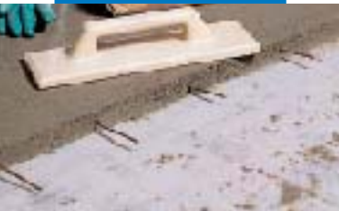
Topcem-Estrich-Verdübelung im Bereich der Arbeitsfugen