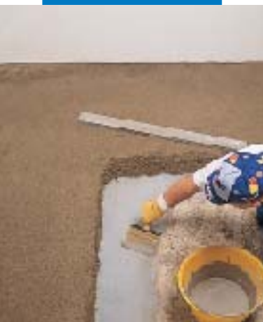
Applikation der Haftschrämme für den Topcem-Estrich