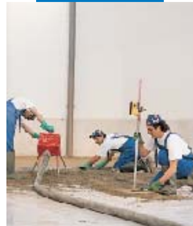
Einbringen des Topcem-Estrichs