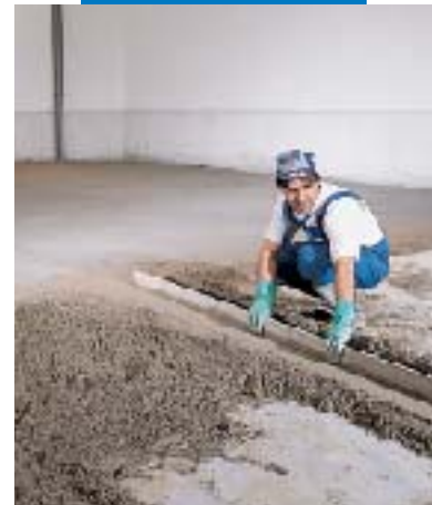
Abziehen des Topcem-Estrichs