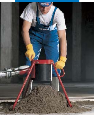
Fördern des Topcem-Estrichmörtels mittels Estrichpumpe

Frischestrich eine erdfeuchte Konsistenz erreicht und dass dieser bei Verdichtung und Oberflächenbehandlung kein Wasser absondert. Der angemischte Frishestrich ist innerhalb einer Stunde zu verarbeiten. Das Anmischen erfolgt mit einem Zwangsmischer. Die Förderung des Frischstoffgemisches kann mittels herkömmlicher Estrichpumpen erfolgen.